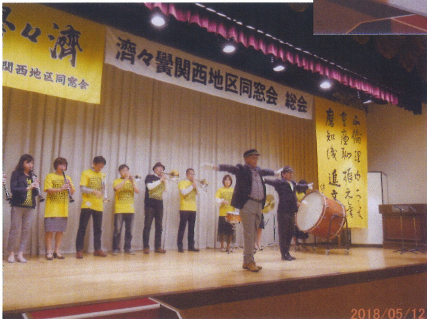
平成 30 年度 総 会